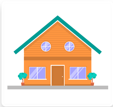
Françoise Marie Louise Héritier